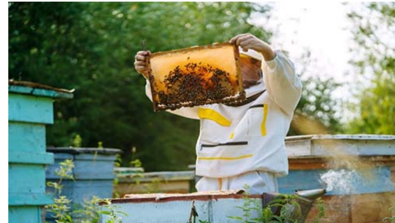
Son Güncelleme: 24.05.2023 11:15

Arıcılık mesleği herhangi bir kaynak tüketimine neden olmaz. Bu yönüyle de en çevreci üretim türlerinden biridir. Arıcılık mesleği çevreci ve sürdürülebilir kalkınmanın lokomotif olması, ekosistem içerisinde böylesine önemli bir canlıya sahip çıkmamızı sağlayacak arıcılık mesleğinin gençlerimiz tarafından tercih edilmesi geleceğimizi doğrudan etkileyecektir. Bu vesileyle geleceğimizi düşünen çevre bilincine sahip tüm gençlerimiz projemizde görev almaya davet ediyoruz."